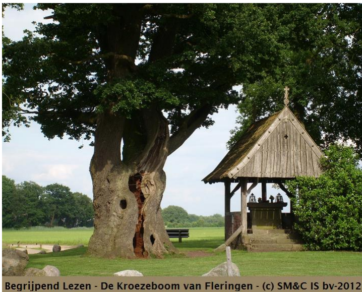
Begrijpend Lezen - De Kroezeboom van Fleringen